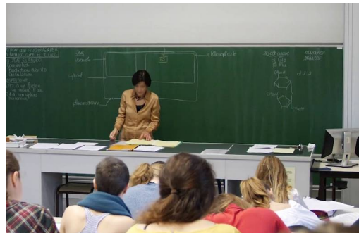
Cours dans l'amphi SVT (56 places)

Les étudiants recrutés dans les classes de BCPST doivent avoir pris en 1ère la triplette Mathématiques, Physique-Chimie et SVT. En terminale, les doublettes suivantes seront examinées : Maths & Physique-Chimie, Maths & SVT et Physique-Chimie & SVT. Dans ce dernier cas (PC+SVT), l'option Maths complémentaires est indispensable et le niveau en mathématiques en première et terminale sera alors particulièrement examiné. Quelques profils différents pourront évidemment être recrutés à la marge et sont en réussites à Janson.