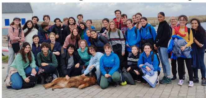
Stage de Terrain Spé 2023 – Sur l'île de Groix