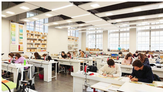
Travail en salle de Géologie

Les classes de BCPST bénéficient des installations et de l'équipement de très grande qualité des laboratoires de sciences de la vie et de la Terre et de sciences physiques ainsi que des salles d'informatique du Lycée. En outre, trois salles spécialisées et remarquablement équipées en matériels scientifiques et informatique sont réservées aux TIPE. L'une d'elle dispose d'une bibliothèque réservée aux étudiants de BCPST, qui s'ajoute à celles des laboratoires et à la bibliothèque générale du Lycée.