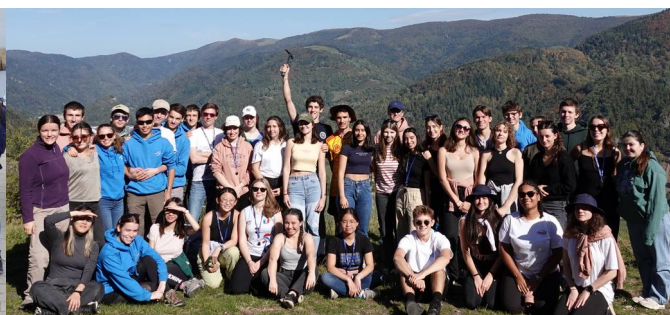
Stage de Terrain Spé 2023 – Alsace