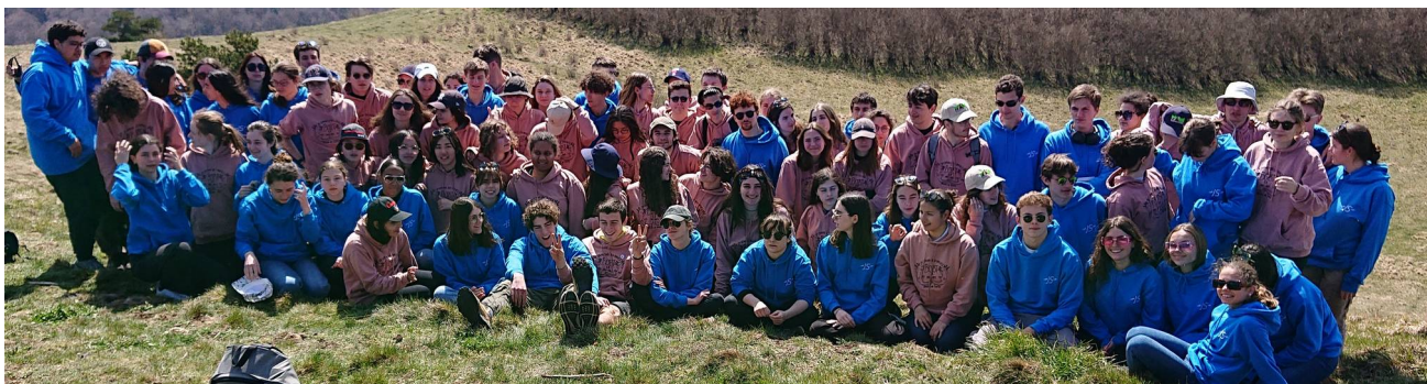
Stage de terrain des deux Sups en commun BCPST1A&1B – 2022

Des voyages d'étude ou stages de terrain (dont un, au moins, de 3 ou de 4 jours soit bien plus que l'impose le programme) sont organisés en 1ère et en 2ème années dans différentes régions de France. Ces voyages permettent une approche concrète de terrain dans le cadre des programmes de géologie, de biologie et de géographie et préparent aux épreuves pratiques et orales des concours. Ils permettent aussi de parfaire la culture naturaliste des étudiants.