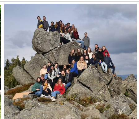
Voyage Alsace – 2021