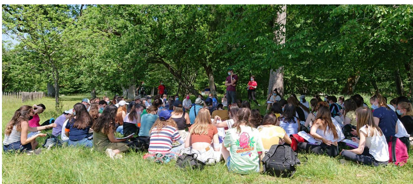
Sortie des deux Sups en commun – 2020

Des voyages d'étude ou stages de terrain (dont un, au moins, de 3 ou de 4 jours soit bien plus que l'impose le programme) sont organisés en 1ère et en 2ème années (nous avons veillé à les maintenir en ces temps de pandémies, surtout en 2ème année où les deux classes ont pu être formées sur le terrain en vue des oraux et TPS de concours) dans différentes régions de France. Ces voyages permettent une approche concrète de terrain dans le cadre des programmes de géologie, de biologie et de géographie et préparent aux épreuves pratiques et orales des concours. Ils permettent aussi de parfaire la culture naturaliste des étudiants.