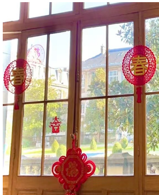
Décoration du hall d'entrée de Janson

Se réunir lors du nouvel an lunaire en salle Clermont pour un Gala est une tradition depuis déjà plus de 5 ans pour les élèves SIC de Janson (section internationale de chinois). Le Covid a joué le « trouble-fête » en 2020 et 2021. Pour célébrer l'entrée dans l'année du Tigre en 2022, les élèves et leurs professeurs se sont dotés de la force du Tigre et ont décidé de célébrer la nouvelle année en trois actes.