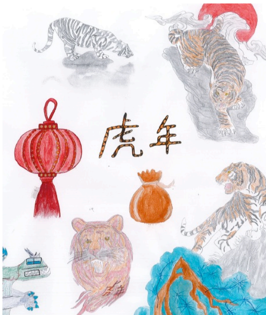
L'année du Tigre (dessin réalisé par Manon Norman 3è 11)