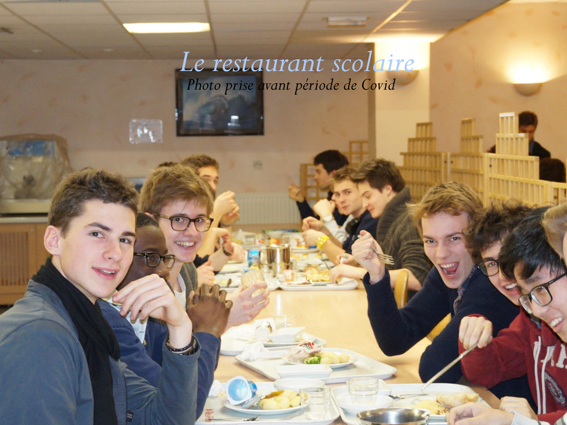
Photo prise avant période de Covid