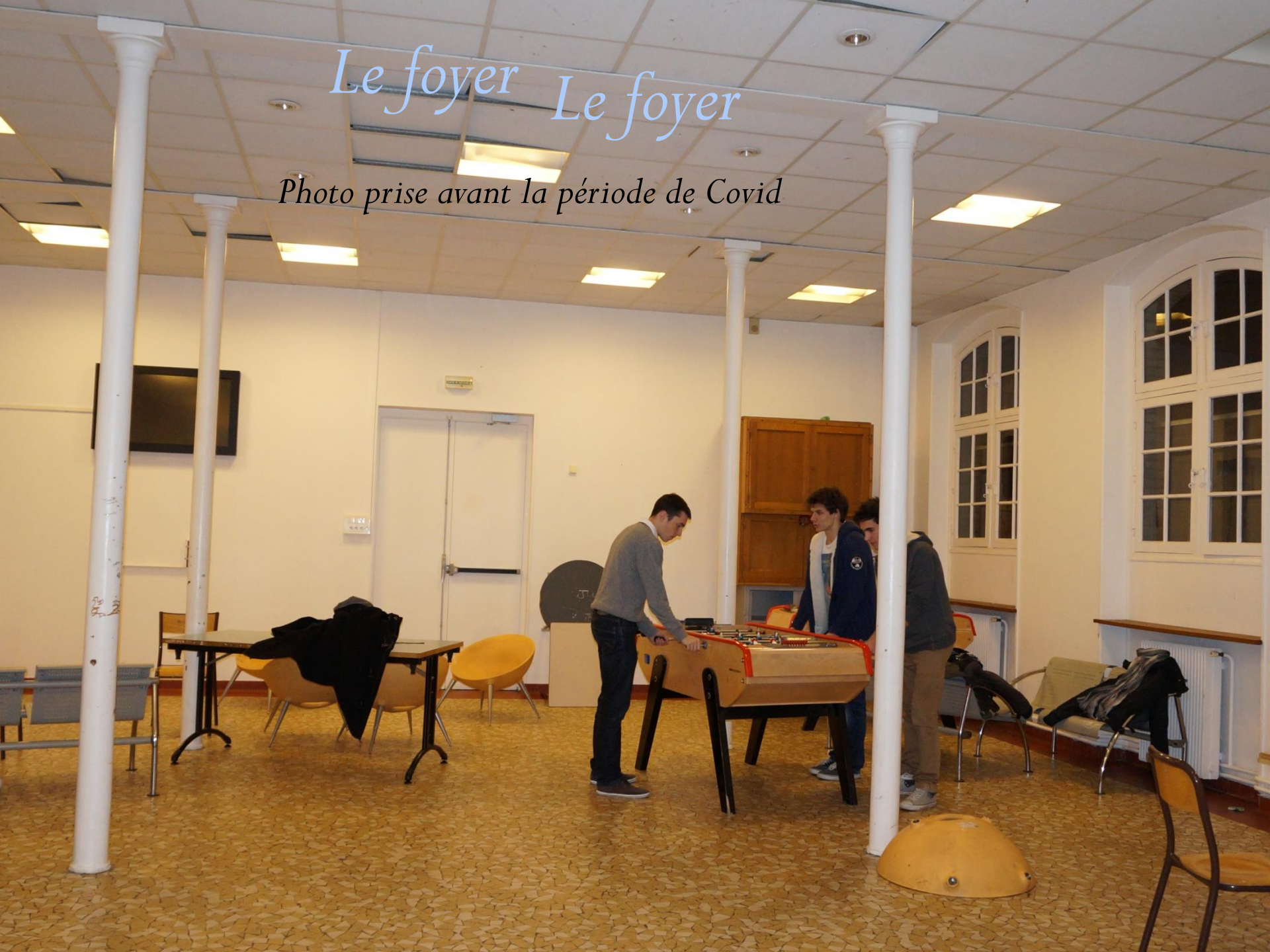
Photo prise avant la période de Covid